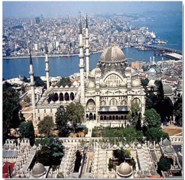
現在のイスタンブール

無尽蔵とも思える歴史遺産や観光資源、紺碧の空や海、うまい食べ物、親しみを抱かせる国民性等々、外国人を惹きつけて止まないが、政治(近代トルコ建国の父ケマルパシャによって打ち立てられた世俗政治)が最近のイスラム政権の登板で揺れているのが気がかりである。(完)